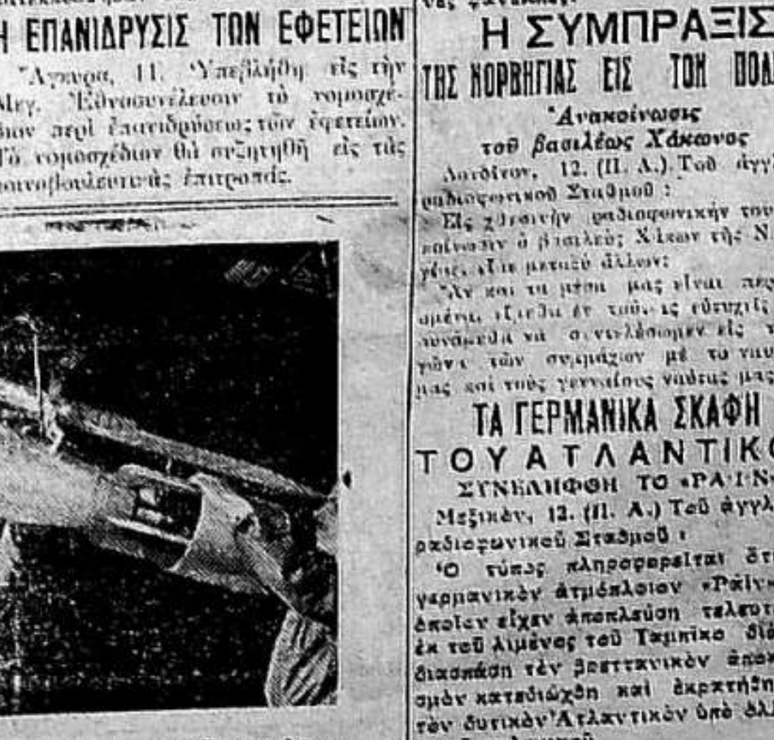
Αναστασιαστικόν τηλεβλέον του Αγγλικού στρατού της δυτικής ερήμου