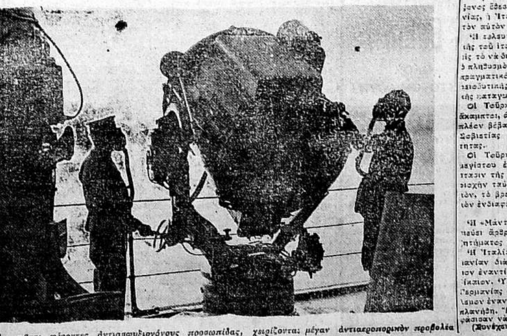
Άγγλοι ναύται, φέρουτες άντιαεροβιοσύνους προσποθείας, χειρίζονται μέγα άντιαεροβιοσύνους προσποθείας

ΑΙ ΓΕΡΜΑΝΟΒΟΥΛΓΑΡ. ΣΧΕΣΕΙΣ Η ΠΑΡΑΜΟΝΗ ΤΟΥ Κ. ΡΟΥΣΤΕΡ ΑΠΕΙΣΙΣ ΠΡΟΣ ΤΙΜΗΝ ΤΟΥ ΓΕΡΜΑΝΟΥ ΥΠΟΥΡΓΟΥ Σάββα, 18. (Π. Α.) Ρέιμπερτ Οι Γερμανοί καταβάλλουν μεγάλας προσποθείας εν Ρουμανία, διά να αποκτήσουν την χώραν ταύτην της μεγάλης βάρης, η οποία θα έπιση τά Βαλκάνια εις την άβραβείτητα της της άσφαλείας.