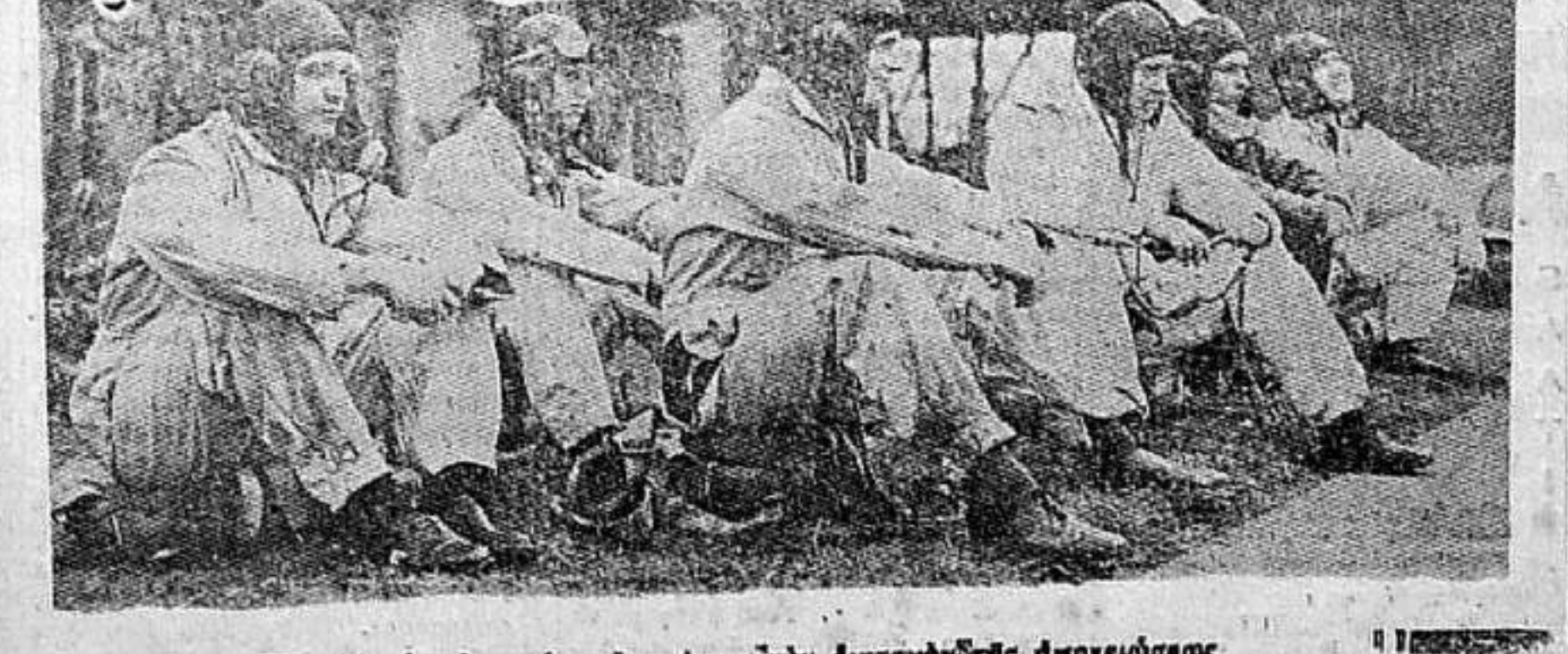
Άγγλοι άεσπεροί άναμένον την άναγνώστη άμορρώσεσ

Λονδίνο, 18. (Π. Α.) Πρό της διεπιστάσεως... Η Γαλλική μοίρα που κινήθηκε προς το Ντακάρ, έφερε μυστηριώδεις σκοπούς που άρρασκουν τον πόλεμο.