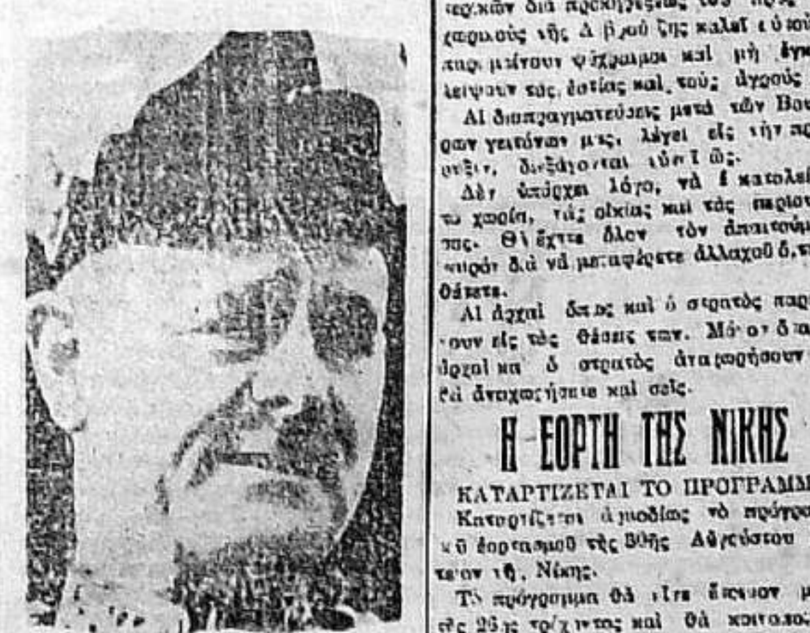
Ο διοικητής τών άγγλικών στρατηγικών τής Έγγυρ άνατάλις στρατηγός ΟΥΒΕΑ